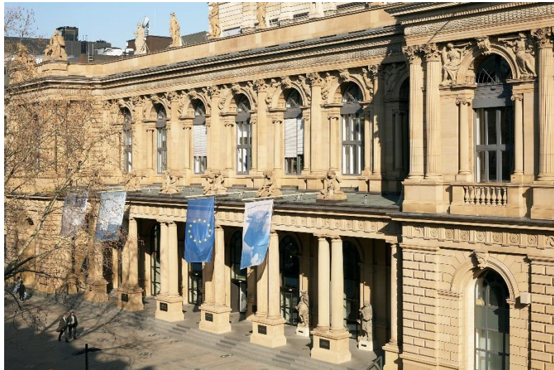
Gebäude der IHK Frankfurt am Main.